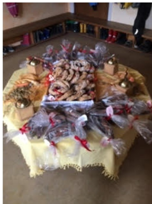
Bagte høst krans: